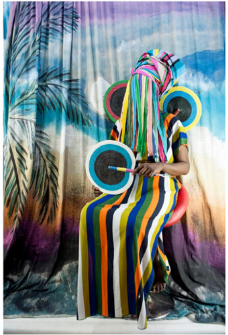
© GLORIA OYARZABAL. WOMAN GO NO'GREE